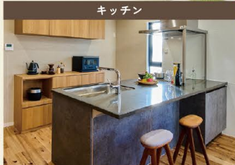
シックな色のキッチンは、家事をする場所ではなく、楽しむための場所。ゆったり料理できる広さを備え、オープンカウンターで食事できる。