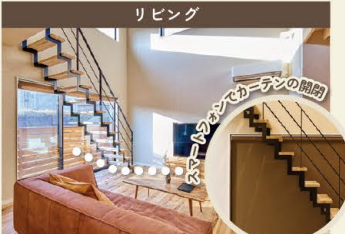
通常より高さのあるハイドアと吹抜けで、際立つ広さと明るさ。床材は、オイル塗装した無垢のヒッコリー。節が多く、表情豊かで遊び心があふれ、無垢の木ならではのぬくもりが伝わる。

■外観 平屋とロフトを組み合わせた、1.5階建ての構造が醸し出す存在感。モスグリーンの塗り壁と、アクセントにレッドシダーを使用した木製部分の暖かさ。落ち着いた雰囲気の外観は、個性的な大人のためのプレミアムデザイン。