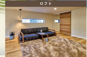
すっきりしたデザインながらも存在感のあるストリップ階段を上って、ロフトへ。スクリーンを下ろすと、一気にプライベートな空間に。読書・音楽・映画…ここでは、好きなことを好きなだけ楽しめる。