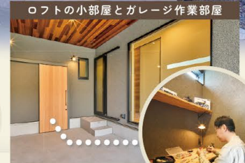
ガレージとロフトの奥にある、小さな隠し部屋。誰にも邪魔されず、趣味を極め、仕事に没頭できる、大人のための秘密基地。住む人の自由な発想で、使い方は無限大。