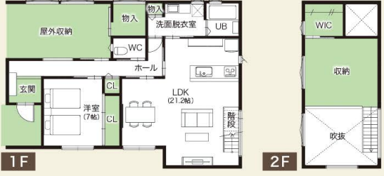
土地面積:191.98㎡(58.07坪) 延床面積:112.47㎡(34.02坪)

落ち着いた雰囲気の外観は、個性的な大人のためのデザイン。吹抜けとロフトで、平屋とは思えない広さと明るさ。好きなことを好きなだけ楽しめる、ここからからだを充電するための大切な空間。この家で、あなたの人生をもっと豊かに、美しく。