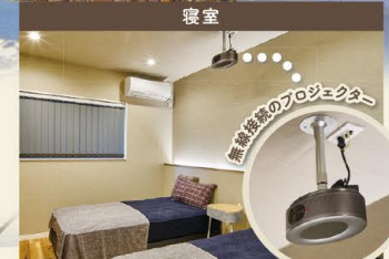
間接照明の優しい光に癒されて思い切りリラックスできる寝室は、プロジェクターとスクリーンを起動するとシアタールームに。ここからからだの両方を充電するための、大切な空間。